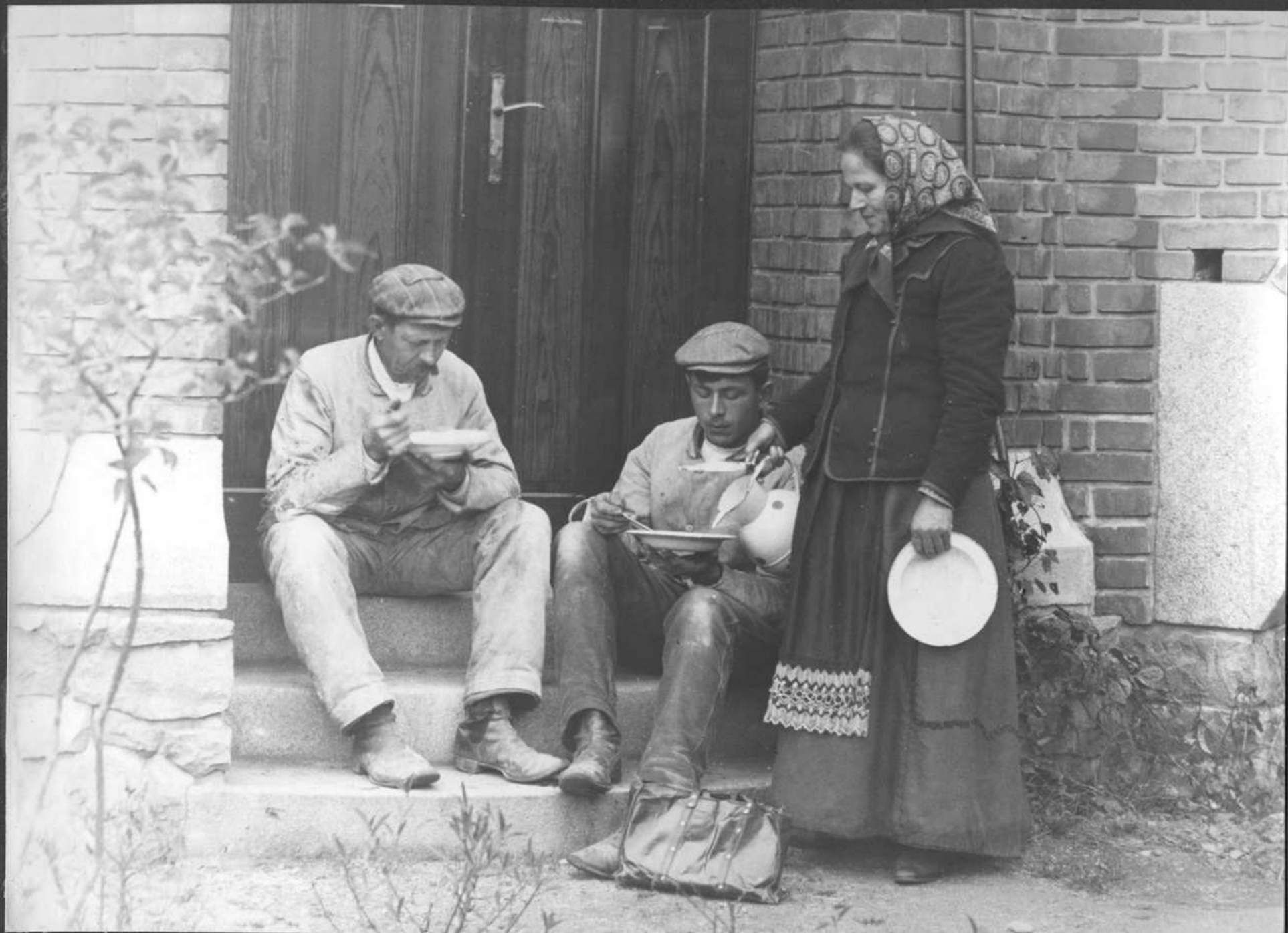
1910 Rodina Ryzcova u centrální kopule