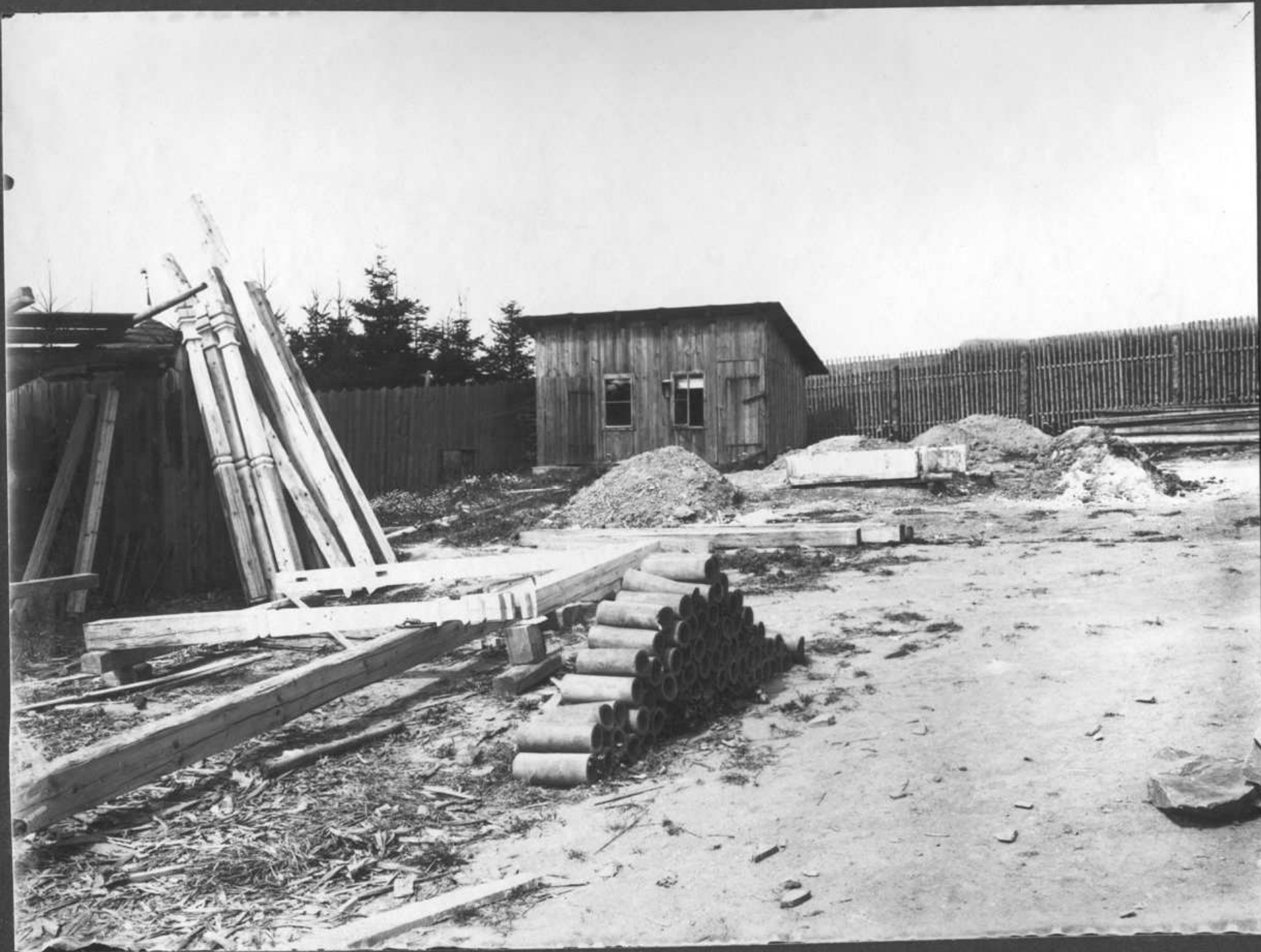
1906 Stará observatoř „U zelené žáby“ před odstěhováním na kopeček