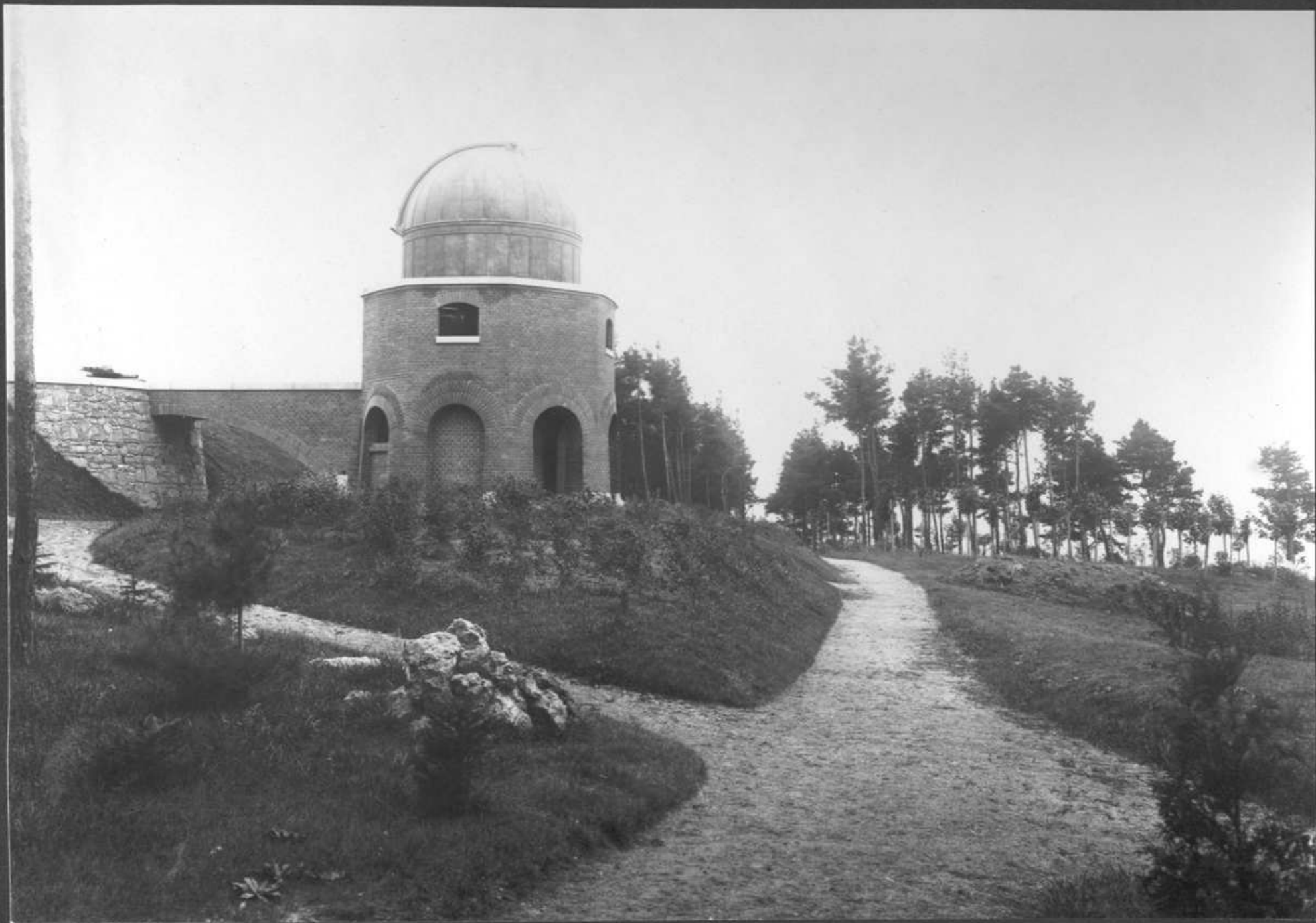
1909 Pohled na západní kopuli od severu