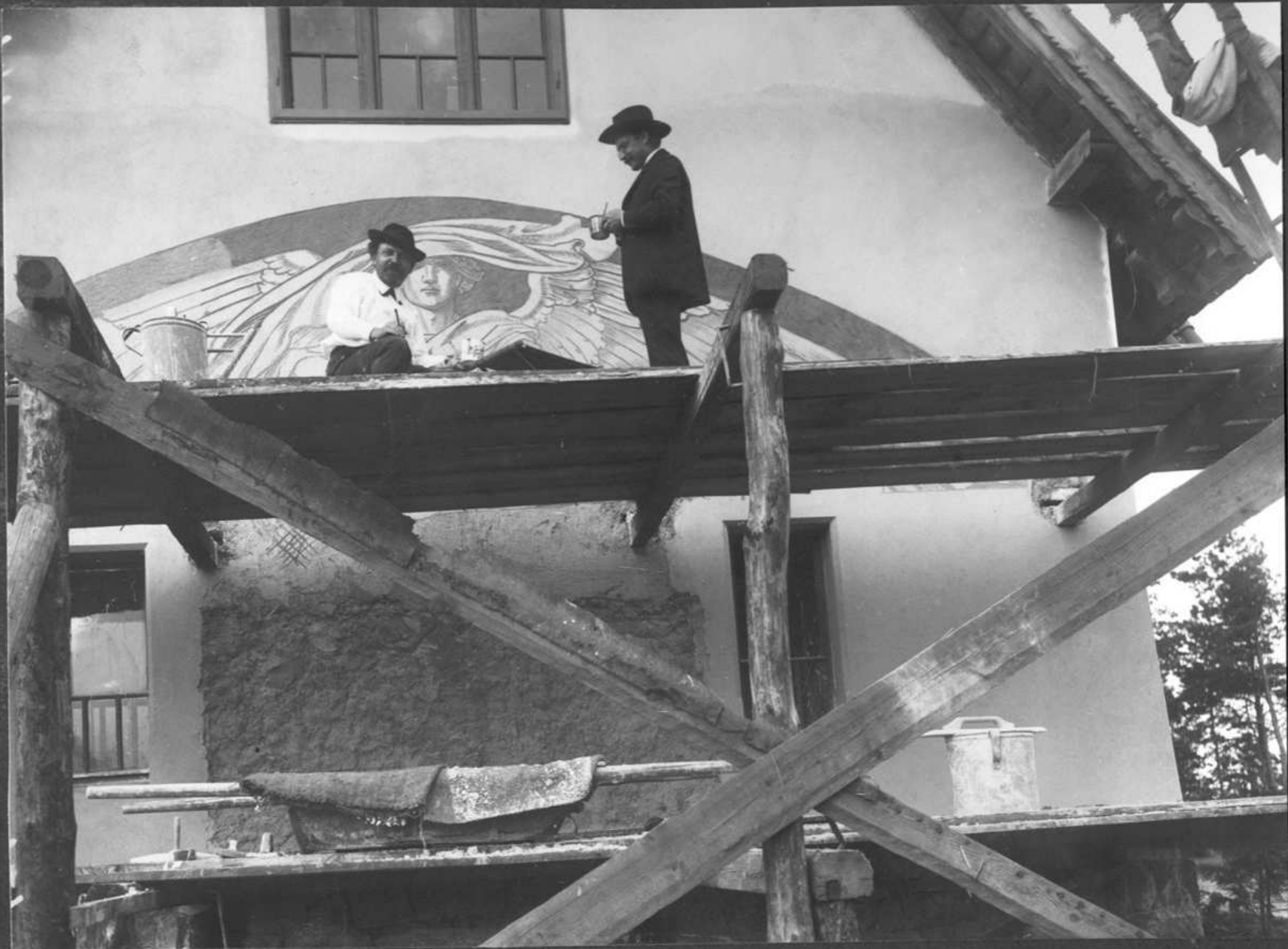
1907 Klusáček a Mašek na lešení u západní figury