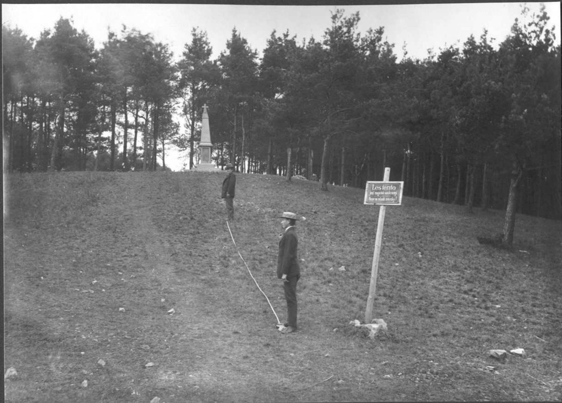
1901 Prostranství před Horáckovým pomníkem před úpravou